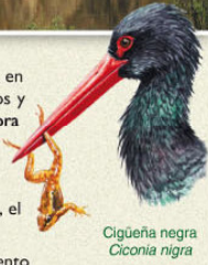
Cigüeña negra Ciconia nigra

Para conocer los importantes valores naturales y culturales que atesora este espacio se han señalado y adecuado para su tránsito las rutas recogidas en este folleto. El visitante, a través de ellas, puede recorrer en diferentes etapas buena parte del territorio de este Espacio Natural y conocer sus municipios.