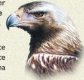
Águila imperial ibérica Aquila adalberti