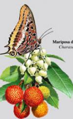
Mariposa del madroño Chlorotus jussiaei Rana patilarga Rana iberica

■ Límite del Parque Natural do Tejo Internacional (Portugal) ■ Límite del Parque Natural del Tajo Internacional (España)