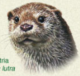
Nutria Lutra lutra