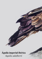
Águila imperial ibérica Aquila adalberti